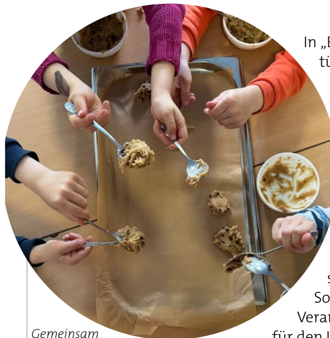
Gemeinsam gesundes Essen zubereiten macht Spaß

In „Ernährungswerkstätten“ tüfteln wir gemeinsam mit dem Träger und der Hauswirtschaft an einem Speiseplan, der gut für den Bauch und gut für die Erde ist. Die Kinder dürfen dabei selbst entdecken, wie spannend regionales Gemüse sein kann – Nachhaltigkeit, die man schmecken kann!