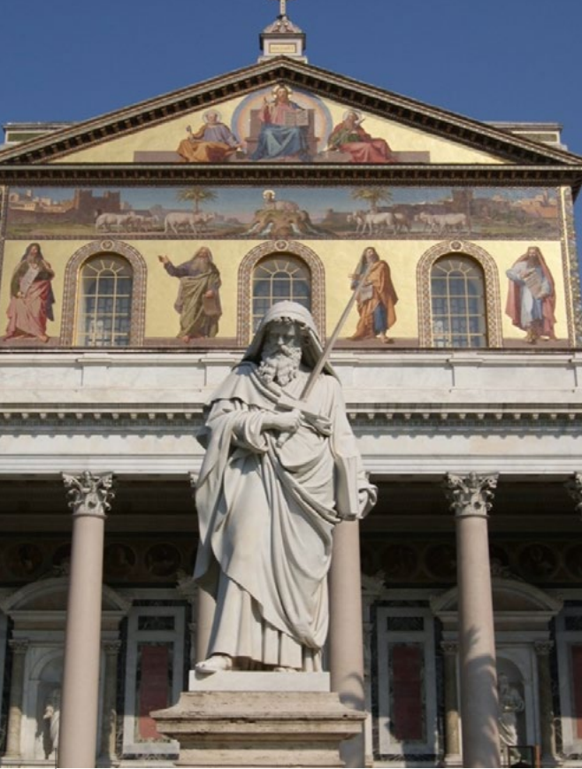
Der Apostel Paulus vor der Kirche Sankt Paulus vor den Mauern in Rom