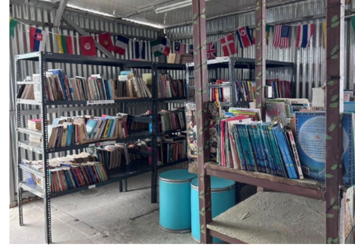
Die Bücherei im Flüchtlingscamp

Sie verschickt auf Nachfrage auch regelmäßig einen Rundbrief.