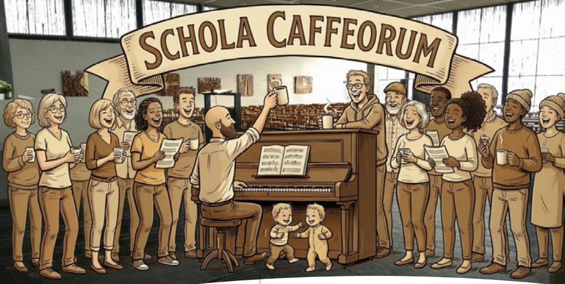
Vielstimmig und offen - die Schola Caffeorum