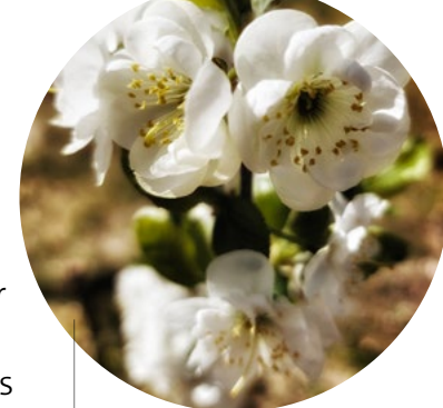
Wachstum erleben - von der Blüte bis zur Frucht

Wir freuen uns riesig, mit beiden Kitas Teil des Pilotprojekts „Apfel & Möhre“ zu sein. Mit einer Förderung von 5.000 € nehmen wir unsere Küche und unsere Essgewohnheiten unter die Lupe. Es geht nicht nur darum, dass die Kinder satt werden, sondern wie.